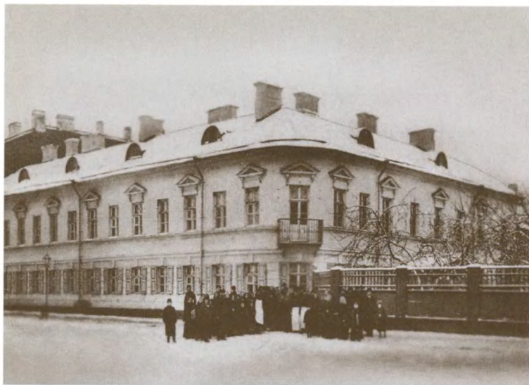
Дом Иоанна Кронштадтского (Кронштадт, ул. Посадская, 21)