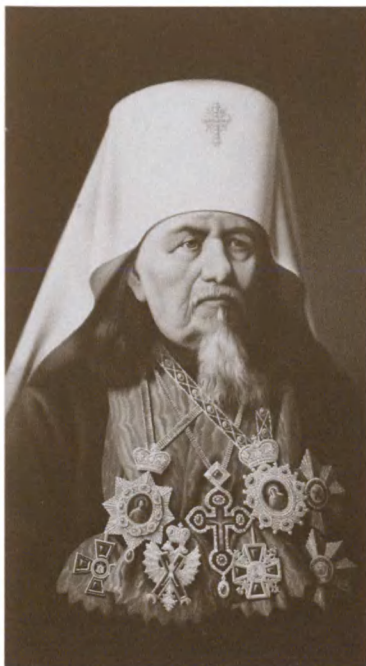
Митрополит Новгородский и Санкт-Петербургский Исидор (Никольский)