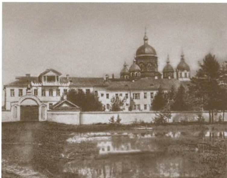
Леушинский Иоанно- Предтеченский монастырь