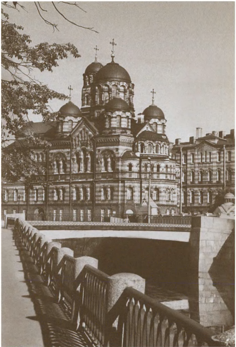
Свято-Иоанновский женский монастырь в Санкт-Петербурге — место упокоения Иоанна Кронштадтского