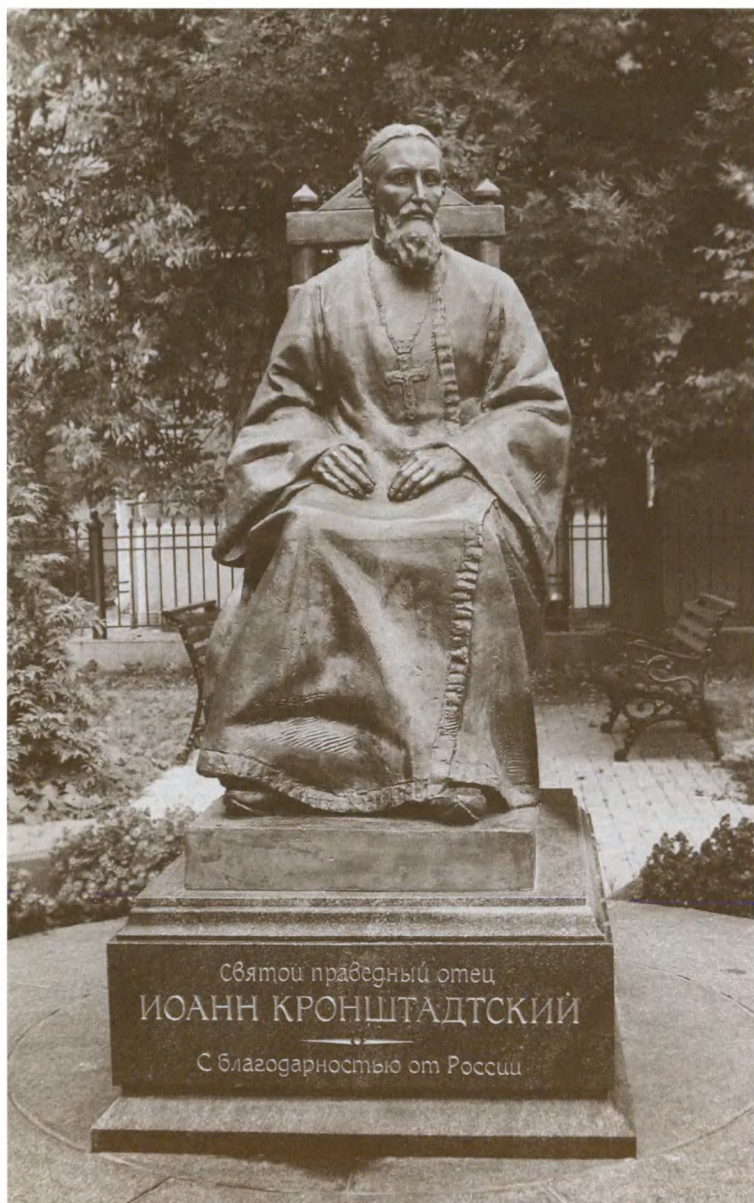
Памятник отцу Иоанну Кронштадтскому (Кронштадт, ул. Посадская, 21)