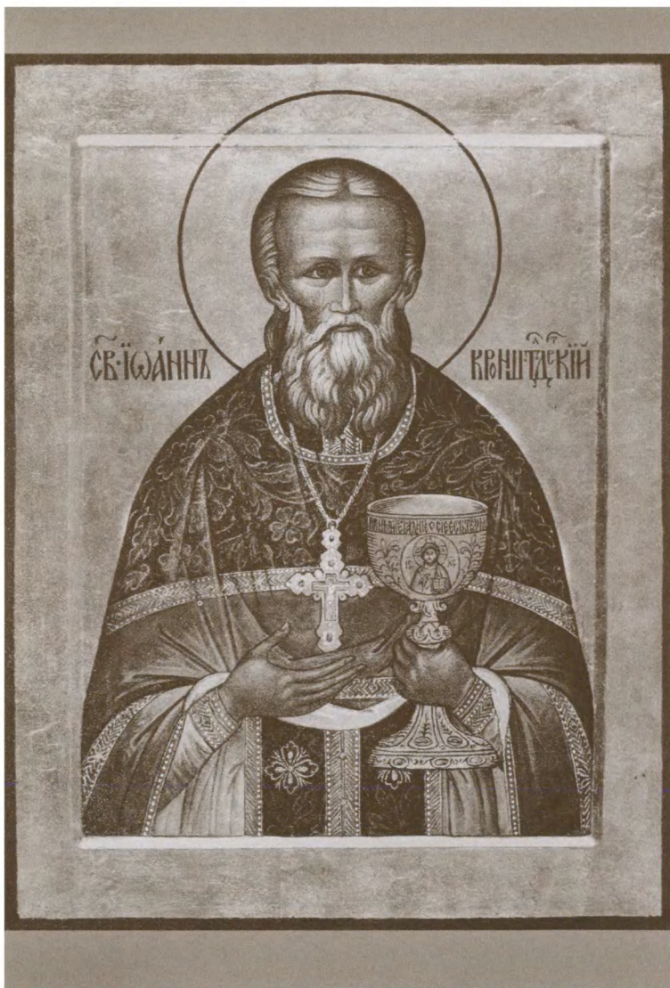
Икона святого праведного Иоанна Кронштадтского