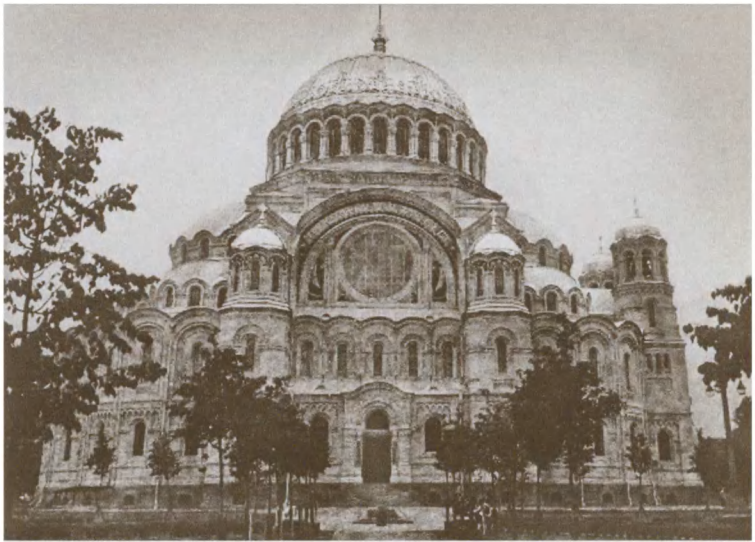
Возрожденный Морской собор во имя святителя Николая Чудотворца в Кронштадте