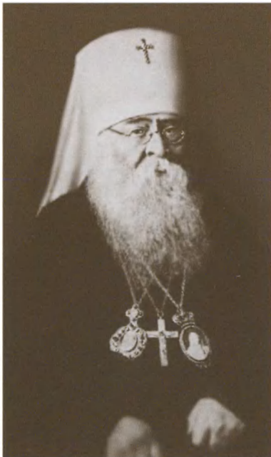
Патриарх Алексей (Симанский). 1945—1970 гг.