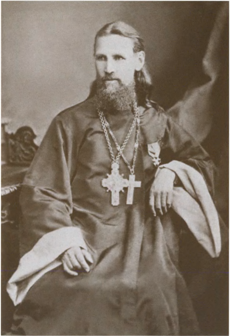
Святой праведный Иоанн Кронштадтский