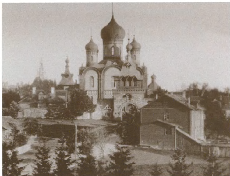
Пюхтицкий Успенский монастырь. Фотография начала XX в.