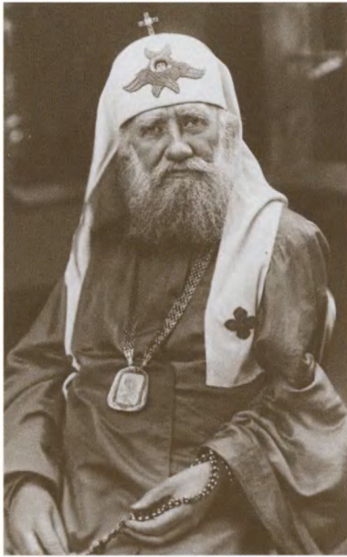
Патриарх Тихон (Белавин). 1917—1925 гг.