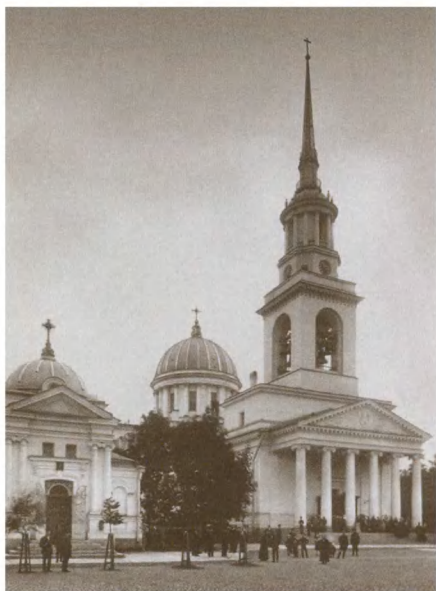
Андреевский собор в Кронштадте. Фотография начала XX в.