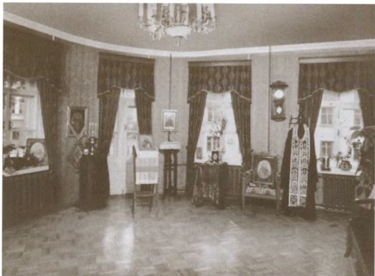
Гостиная зала в квартире отца Иоанна